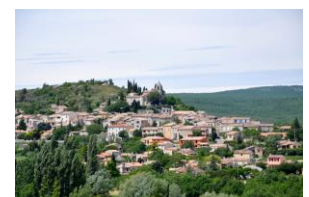
Saint Michel l'Obs.