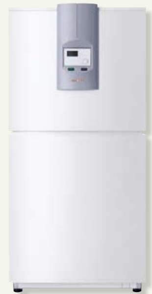
Version intérieure IK